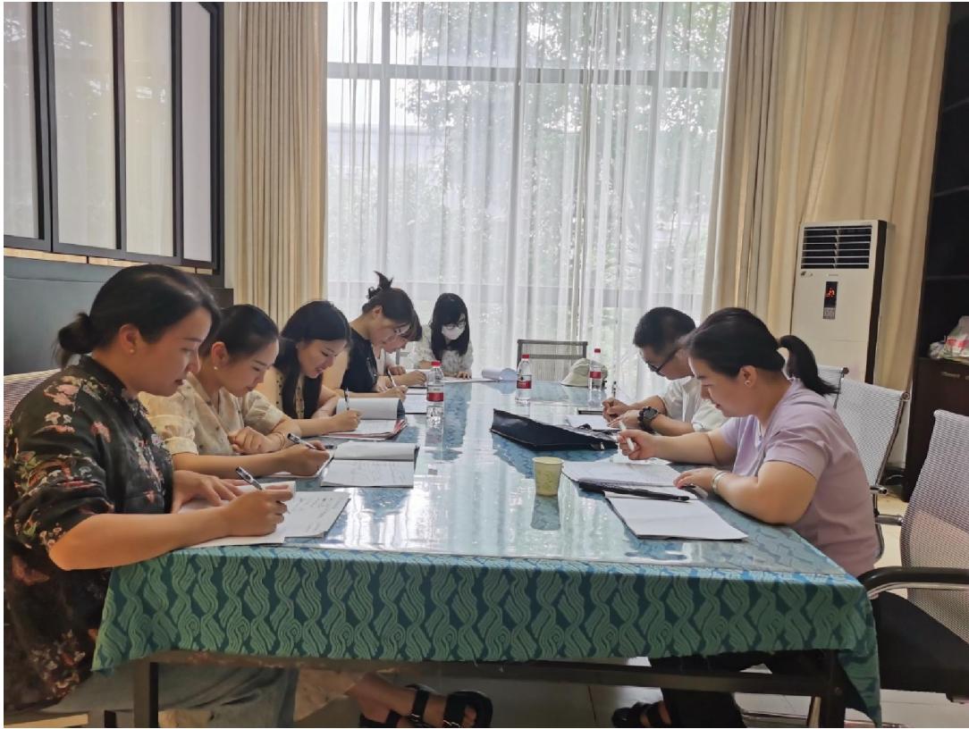
案例四：邀请国赛冠军来学校指导培训老师和学生